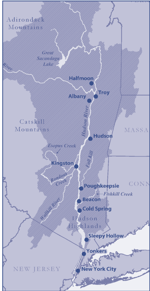
Josh Clague (map & Black Creek photo)